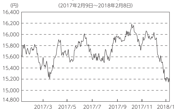
【ベンチマークの推移】