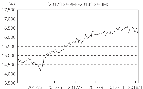
【ベンチマークの推移】