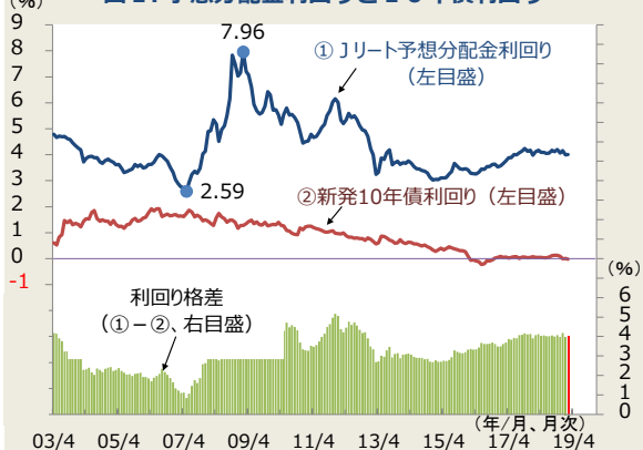
図1. 予想分配金利回りと10年債利回り

(注) 月末値。Jリート予想分配金利回りは、東証上場REITの予想分配金利回り。 2008年4月以前のデータはしんきん投信が算出、それ以降は、QUICKが算出。