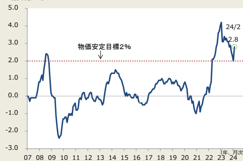
（前年比、%） 図2. 消費者物価

（注）消費者物価は生鮮食品除く総合、消費増税分を除く （出所）総務省よりデータ取得し、しんきん投信作成