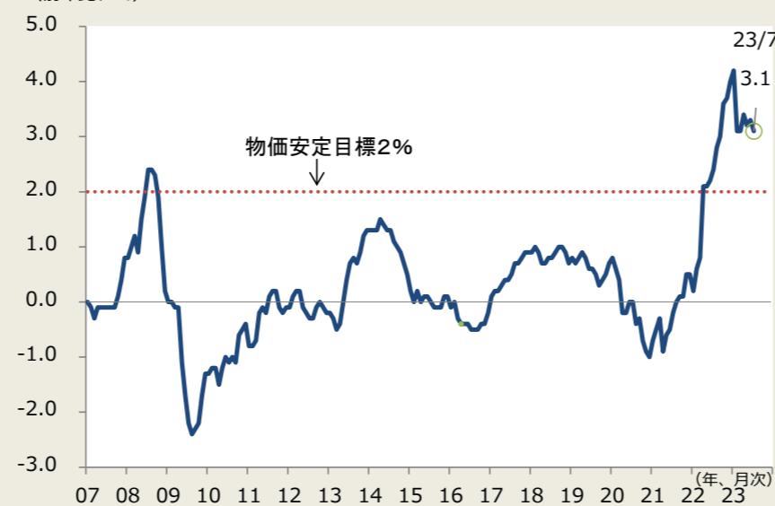
（前年比、%） 図2. 消費者物価

（注）消費者物価は生鮮食品除く総合、消費税分を除く （出所）総務省よりデータ取得し、しんきん投信作成