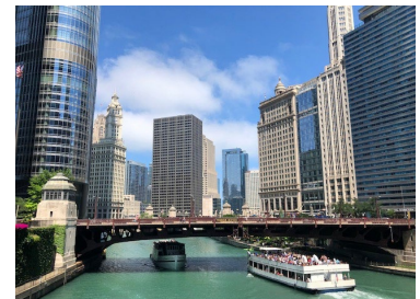
写真2. シカゴの象徴的な風景 遊覧船は観光客で賑わう