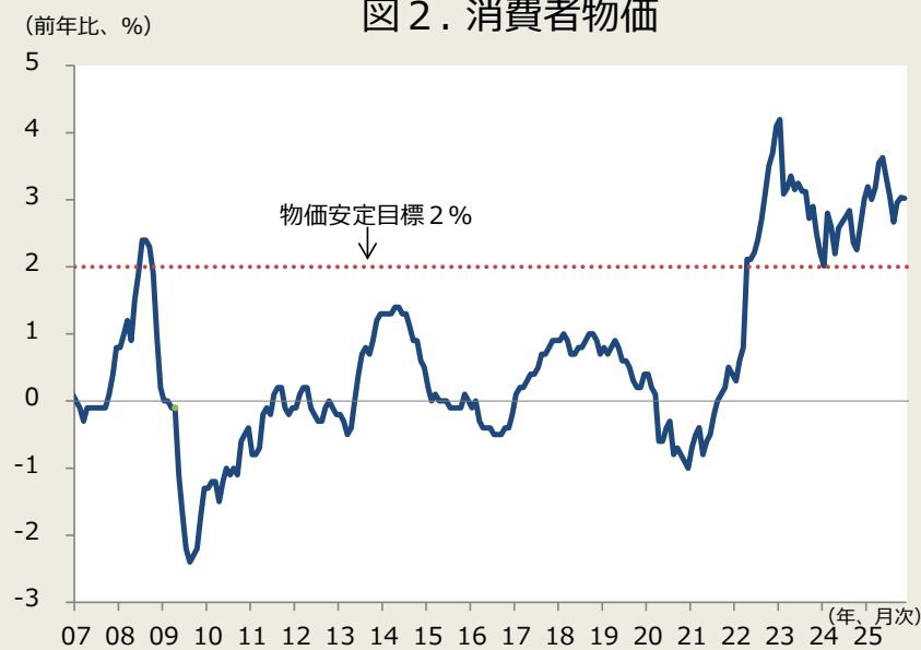
(前年比、%) 図2. 消費者物価

(注) 消費者物価は生鮮食品除く総合、消費税率引き上げによる影響を除く系列。