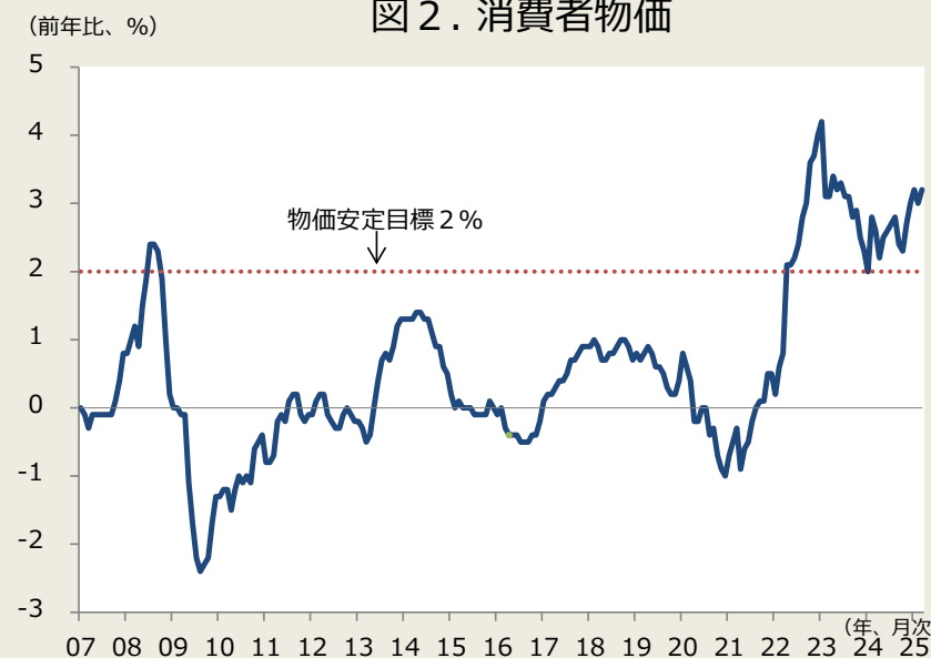
(前年比、%) 図2. 消費者物価

(注) 消費者物価は生鮮食品除く総合、消費税率引き上げによる影響を除く系列。 (出所) 総務省よりデータ取得し、しんきん投信作成