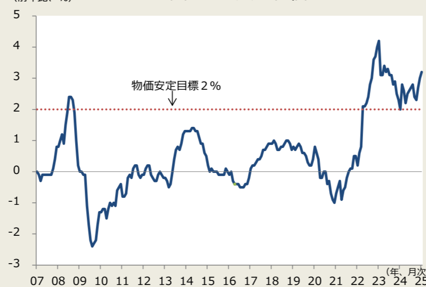
（前年比、%） 図2. 消費者物価

（注）消費者物価は生鮮食品除く総合、消費税率引き上げによる影響を除く系列。