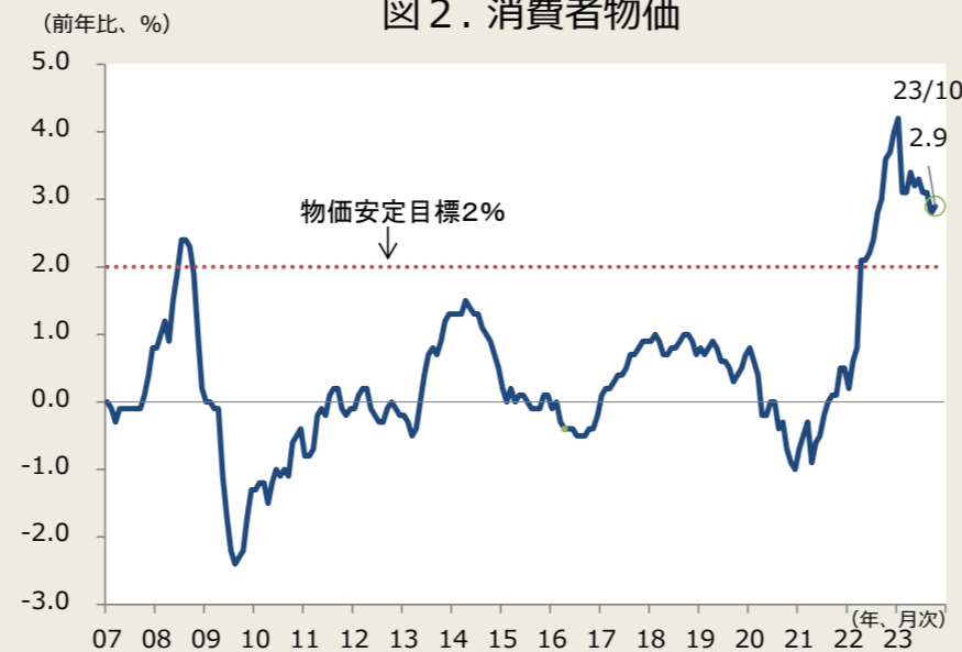
（前年比、%） 図2. 消費者物価

（注）消費者物価は生鮮食品除く総合、消費増税分を除く