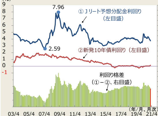
図1. 予想分配金利回りと10年債利回り

(注) 月末値。Jリート予想分配金利回りは、東証上場REITの予想分配金利回り。 2008年4月以前のデータはしんきん投信が算出、それ以降は、QUICKが算出。