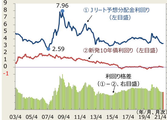
図1. 予想分配金利回りと10年債利回り

(注) 月末値。Jリート予想分配金利回りは、東証上場REITの予想分配金利回り。 2008年4月以前のデータはしんきん投信が算出、それ以降は、QUICKが算出。