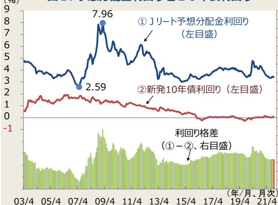
図1. 予想分配金利回りと10年債利回り

(注) 月末値。Jリート予想分配金利回りは、東証上場REITの予想分配金利回りで、QUICKが算出。2008年4月以前のデータはしんきん投信が算出、それ以降は、QUICKが算出。